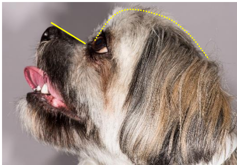
Figuur 3. Zichtbaar oogwit ten gevolge van een ondiepe oogkas bij de alerte, recht naar voren kijkende hond (kwadranten arceren)