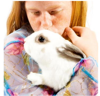
Dit konijn is niet ontspannen!

Kijk hoe het konijn op u reageert. Zit het er ontspannen bij als u het aait? Vindt het konijn het vervelend om opgetild te worden? Veel konijnen vinden dit eng, als prooidier hebben ze graag hun pootjes op de vloer zodat ze kunnen vluchten als dat nodig is. Vastgehouden worden lijkt voor hen al snel op gegrepen (en opgegeten) worden. Het kan soms lastig zijn om te zien dat een konijn het eng vindt: niet elk konijn probeert meteen te vluchten. Een konijn dat gespannen is, spert zijn ogen open en trekt vaak de neus aan de zijkant wat in terwijl de bovenkant van de neus iets opgetild wordt, waardoor de neus er puntiger uitziet dan als het dier ontspannen zit. Zijn spieren voelen gespannen aan. Maar er zijn ook konijnen die er helemaal aan gewend zijn en er geen bezwaar tegen hebben om gezellig bij u op schoot te zitten. Overigens kunt u ook prima uw konijn aaien en knuffelen als u zelf op de grond naast het konijn gaat zitten, bijna elk konijn dat mensen gewend is vindt dat wel prettig.