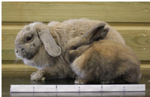
Nederlandse hangoordwerg met moeder, 40 dagen. De oren gaan pas hangen als de dieren wat ouder zijn!