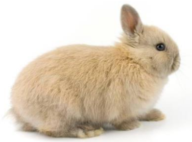
Dit is een dwergkonijntje

worden. Om u een idee te geven van het formaat van jonge konijntjes en hoe groot zij worden kunt u bij de foto's op de volgende pagina kijken. U kunt bijvoorbeeld letten op de maat van de oren ten opzichte van de rest van het konijn; echte dwergjes hebben relatief korte oortjes, konijnen met langere oren worden meestal groter en zijn op een leeftijd van zes weken dus ook wat groter. Hele jonge konijntjes hebben een wat rondere kop, bij de meeste rassen wordt de kop als ze wat ouder zijn wat spitsers van vorm. Uitzonderingen daarvan zijn de dwergkonijnen en ook de Duitse en Franse Hangoor, zij hebben ook als ze volwassen zijn een vrij ronde kop.