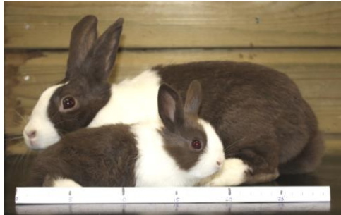
Hollander met moeder, 30 dagen

De strepen op de maatbalk geven steeds 5 cm aan.