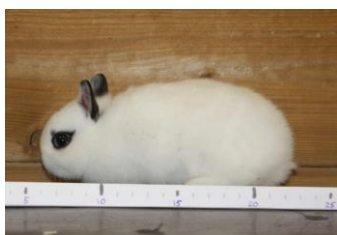
Kleurdwerg, 26 dagen