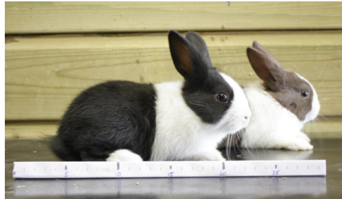
Hollanders, 42 dagen