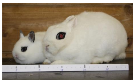
Kleurdwerg met moeder, 26 dagen