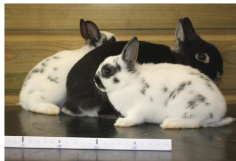
Kleurdwergen met moeder, 46 dagen