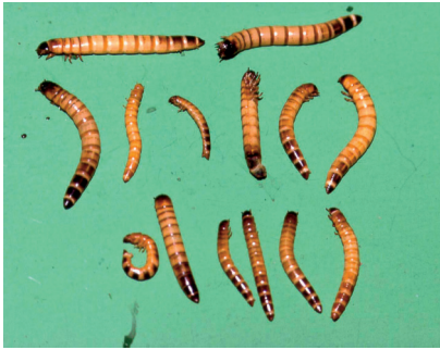
Meelwormen ( Tenebrio molitor ). Algemeen ziek. Sommigen lagen krom. Ze bewogen zich stijf, de uiteinden waren donker verkleurd. (Infectie met Microsporidium sp.).

aspect daarbij is dat alle titels (bijvoorbeeld ook Poolse en Hongaarse) in het Engels moesten worden vertaald.