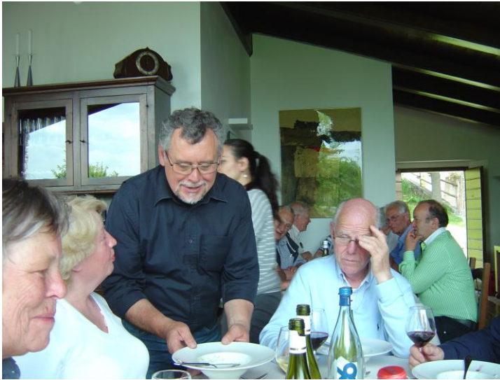
Met o.a een pasta met een saus van op eigen land gevonden truffels