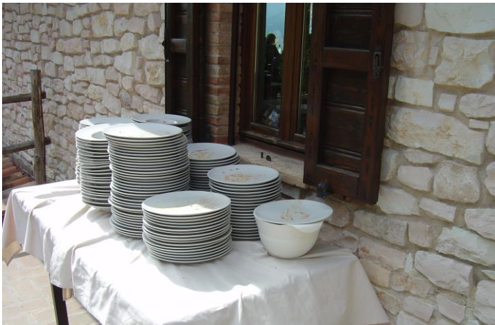
Laat niet als dank.....