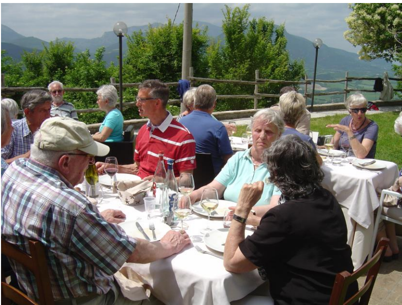
Aan tafel in de zon. En heerlijk lunchen