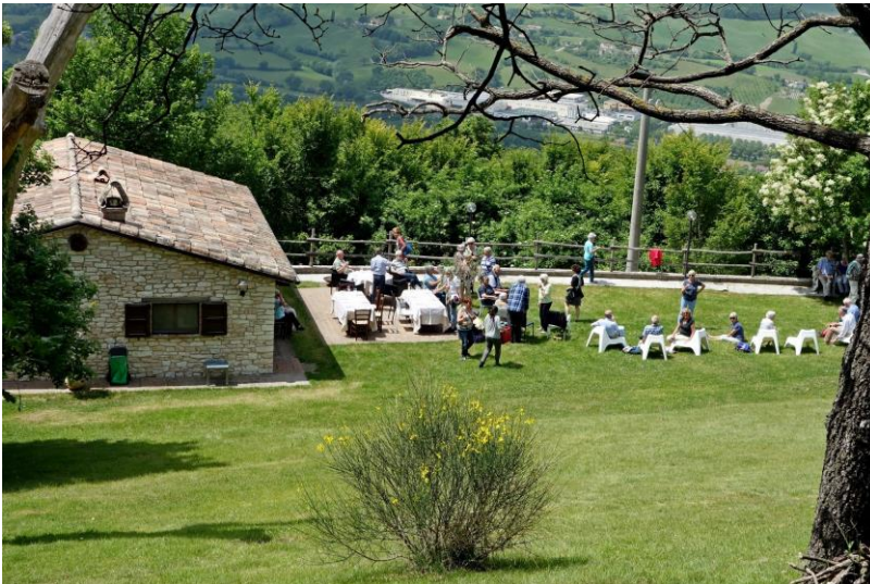
Een prachtige plek waar het goed toeven is.